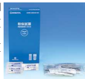
粉体試薬 DPD 法用 (100 回分)