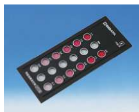
樹脂比色板 DPD 法用