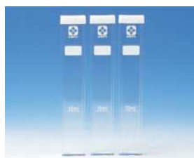
角形試験管 シリコンキャップ付