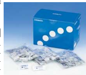
粉体試薬 DPD 法 徳用 (500 回分)