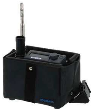
品目コード:080610-5002 品名:室内環境測定セット IES-5000型