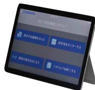
品目コード:080610-50105 品名:タブレットPC 10.5インチ IES-5000用