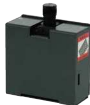
品目コード:080170-085 品名:デジタル粉じん計 LD-2i型